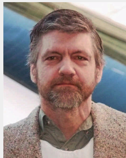
Ted Kaczynski, 1996

Theodore John “Ted” Kaczynski (geboren 22 mei 1942), ook bekend als de “Unabomber”, is een zelf verklaard anarchist uit de Verenigde Staten en die bekend werd door een reeks mysterieuze bomaanslagen die de VS tussen 1978 en 1995 in diens greep hielden. Na jarenlange opsporing werd hij uiteindelijk op 3 april 1996 gearresteerd in zijn schuilplaats in de bossen van Montana. Hij werd veroordeeld voor een levenslange gevangenisstraf.