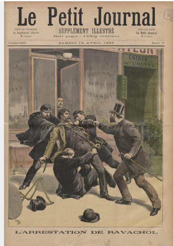
Voorpagina van Le Petite Journal over de arrestatie van Ravachol.

Maison Véry opgepakt (waarna dit café zelf ook doelwit werd van een bomaanslag).