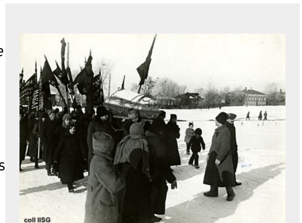
coll IISG De laatste massademonstratie van anarchisten tijdens de begrafenis van Kropotkin - 13 feb. 1921.

Op 8 februari 1921 stierf hij en op 13 februari vond de begrafenis plaats. Alfred Rosmer, zeker geen kritiekloos bewonderaar van Kropotkin, die namens de Rode Vakverenigings Internationale (RVI) op het kerkhof sprak, schrijft in Moscou sous Lénine : "De zwarte vlaggen zwaaiden door de lucht en er werden ontroerende liederen gezongen. Op het kerkhof ontstond er een kort maar heftig incident tijdens de eerste redevoeringen. Een Petrogradse anarchist was al enige tijd aan het spreken, toen er gedempte maar verhitte