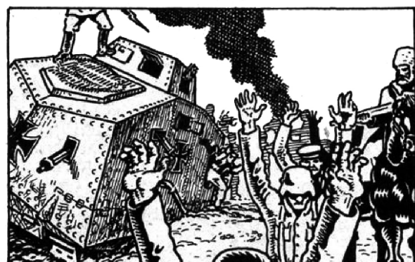
UITEINDELIJK VERSLOEG HIJ EEN DUITSE DIVISIE, DIE GESTUURD WAS OM HEM TE ONDERWERPEN. HIJ TROK NAAR HET NOORDEN EN VERVING DE BOLSEWISTISCHE COMMISSARISSSEN DOOR LIBERTAIRE (ANARCHISTISCHE) COMMUNES.