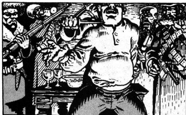
NESTOR MAKHNO VERZAMELDE EEN GUERRILLALEGER EN VIEL DE DOOR DE DUITSERS GESTEUNDE LANDEIGENAREN LASTIG. HIJ GEBRUIKTE HIERBIJ VAAK VIJANDELIJKE VERMOMMINGEN OM EERST HUN GASTVRIJHEID TE VERKRIJGEN.