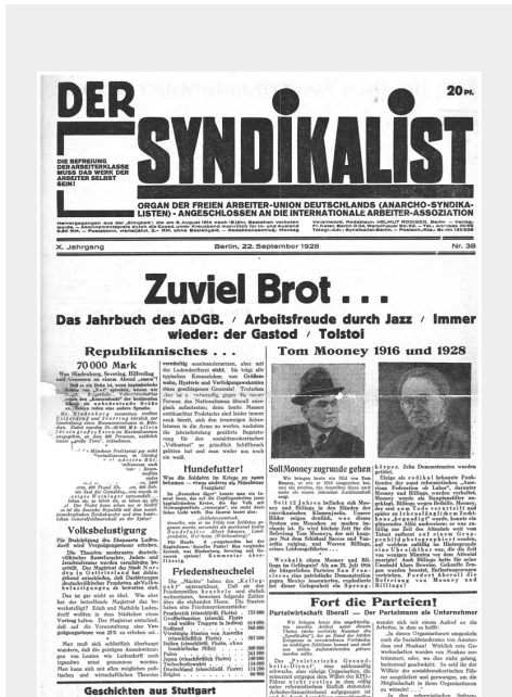
Voorpagina Der Syndikalist (1928), krant van de FAUD