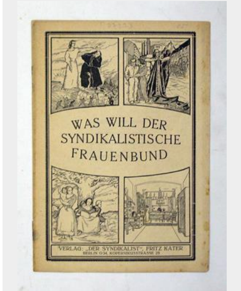
Oude uitgave van "Was will der Syndikalistische Frauenbund?" (1923)