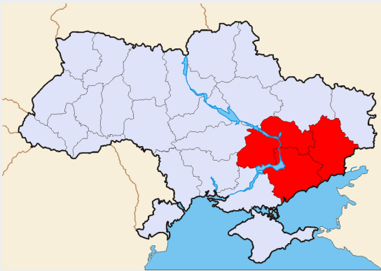
De Vrije Zone in het huidige Oekraïne

Makhno te vermoorden, deze werden echter ontdekt en uitgeschakeld nadat ze hun opdracht hadden bekend.