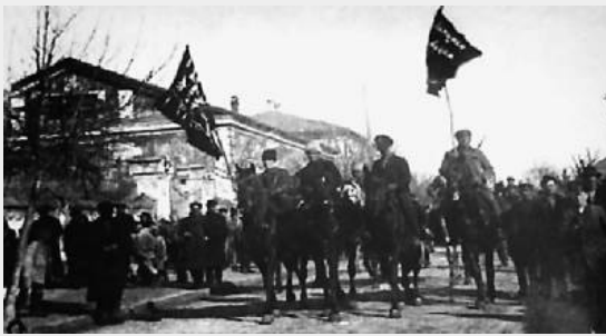
an de Makhnovshchina

Doorheen de maand februari werd het gebied van de Makhnovshchina (dat ondertussen bekend stond als het "vrije territorium" van Oekraïne) overspoeld door Rode troepen. Hieronder bevonden zich de 42ste divisie en de Letse en Estonische divisie die samen met de andere rode eenheden minstens 20,000 soldaten telde.