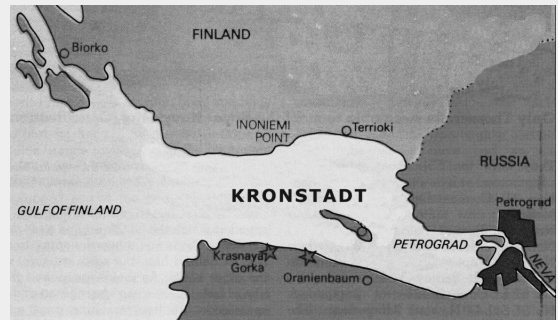
Ligging van Kronstadt t.o.v. Petrograd