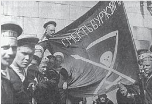
Kronstadt-matrozen met vlag

De Kronstadtsovjet proclameerde autonoom te zijn en wilde alleen voor zaken die het gehele land aangingen overleggen met de Voorlopige Regering. Aleksandr Kerenski dreigde meermaals met ingrijpen, maar nam uiteindelijk geen maatregelen. Na de Oktoberrevolutie hadden de bolsjewieken de macht in het land overgenomen. Al snel begonnen ze de sovjets ondergeschikt te maken aan de Communistische Partij. De sovjet in Kronstadt kon echter lange tijd zijn onafhankelijkheid behouden. Lenin zag af van interventie, mede omdat de matrozen dapper hadden meegestreden tijdens de revolutie. Toen de bolsjewieken in de Sovjet tijdens de verkiezingen van april 1918 terugvielen van 46% naar 29% [3] achtte Lenin het echter tijd om ook daar in te grijpen.