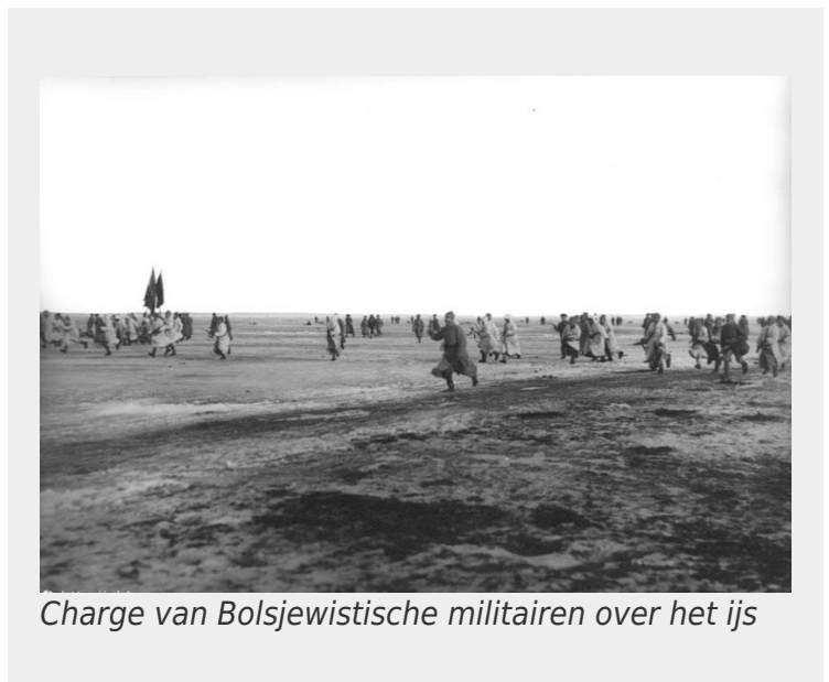
Charge van Bolsjewistische militairen over het ijs

Op 8 maart bestormden infanterie-eenheden van Toechatsjevski de stad vanuit een sneeuwstorm, in witte 'spookachtige' pakken, maar de aanval werd door de Kronstadters afgeslagen: veel van de Rode infanteristen werden kansloos neergeschoten of vonden de dood in de gaten die de zware wapens van de opstandelingen in het ijs hadden geschoten. Generaal Toechatsjevski plaatste Tsjeka-agenten met machinegeweren achter de infanterie om soldaten die zonder bevel terugtrokken dood te schieten.[4]