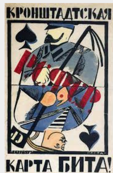
Bolsjewistische propaganda: Kronstadt-rebellen gelijkgesteld met contra- revolutionaire Witte Garde

Vanaf 3 maart begon er ook een soort van propagandastrijd tussen de Kronstadtse editie van Izvestia en Radio Moskou. Welbeschouwd vormde het wegvallen van het Kronstadtse bolwerk een blamage voor de bolsjewieken. Trotski had in 1917 nog geroepen dat de matrozen van Kronstadt 'de trots van de Revolutie' waren. Ze probeerden nu hun gezicht te redden door te beweren dat de opstandelingen in Kronstadt niet dezelfde waren als in 1917, dat de beste proletarische matrozen tijdens de Burgeroorlog het leven hadden gelaten en vervangen waren door 'boerenkinkels in matrozenpakken, die vanuit hun dorpen kleinburgerlijke en anarchistische houdingen met zich meebrachten'.