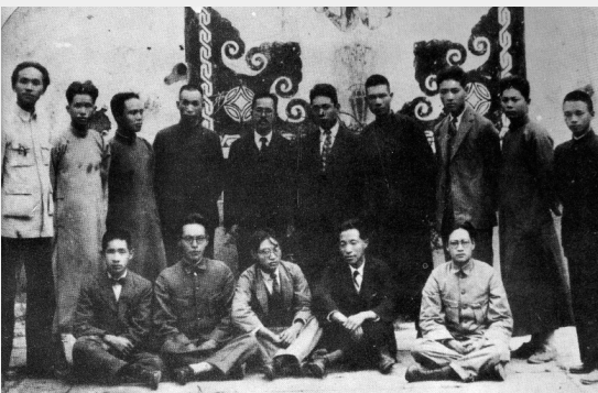
Oprichters van KVAM in 1928.

De Koreaanse Volksassociatie in Mantsjoerije (KVAM) werd in 1929 opgericht[1] na een fusie van de Koreaanse Anarchistische Federatie in Mantsjoerije en de Koreaanse Anarcho-Communistische Federatie . [2] Het project had tot doel een onafhankelijke, zelfbestuurd systeem te vestigen in verzet tegen het Japanse imperialisme.