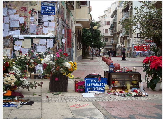
Plek waar Alexandros Grigoropoulos werd doodgeschoten.

De grootte van de opstanden en de spectaculaire straatgevechten waarbij veel gebruik werd gemaakt van molotovcocktails en vuurwerk gaf het insurrectionalisme ook op andere plekken in Europa een impuls. In Nederland bestond van 2009 tot 2011 de groep rond Olie op het vuur , welke meerdere discussieteksten publiceerden en mobiliseerden voor demonstraties. Tevens was drukkerij Roofdruk een belangrijke uitgeverij van insurrectionalistische publicaties, met Nederlandse vertalingen van Alfredo Bonanno , Michael Bakoëin , Albert Libertad ed.