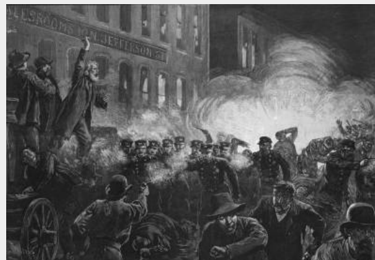
Gravure van de explosie op Haymarket Square tijdens de manifestatie voor een 8-urige werkdag.

De Haymarket-affaire (ook wel bekend als de Haymarket Riot ) is de benaming voor een vier dagen durende demonstraties in Chicago (Verenigde Staten) voor een achturige werkdag, de repressie en de onlusten die erop volgden en het proces tegen de acht anarchisten die daarvoor verantwoordelijk werden gesteld. Zij kregen in een showproces de schuld voor een explosie bij de manifestatie op 4 mei, waarbij acht agenten om het leven kwam. Door toedoen van de politie stierven die dag ook meerdere arbeiders. Hoewel er voldoende bewijs is dat géén van de aangeklaagden verantwoordelijk was voor het gooien van de bom, werden allen veroordeeld. Zeven van hen de doodstraf en één van hen 15 jaar gevangenisstraf krijgen opgelegd. De internationale mobilisatie voor de vrijlating van de 8 veroordeelden zou aanleiding worden voor de internationale 1 mei viering, de Dag van de Arbeid(ers) . 1 Mei was de eerste dag van de mobilisatie voor de 8-urige werkdag in Chicago.