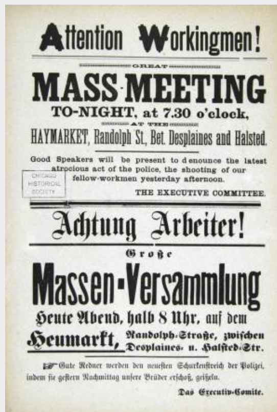
Het pamflet dat oproept tot de

Arbeiders in het Chicago van 1886 wonen in ghetto’s die arbeiderswijken genoemd worden. Daar leven ze in menonwaardige omstandigheden. Duizenden immigranten voeren dagelijks de strijd om te overleven, wonen in krottenwijken en moeten voor een bijzonder laag loon van vroeg tot laat in de avond werken. In schril contrast staat het Chicago van de bourgeoisie, de rijke burgerij. Zij wonen in grote luxe huizen en laten zich bedienen door slecht betaald personeel. Deze mensen weten hun rijkdom te vergaren door anderen in hun fabrieken en werkplaatsen het zware werk te laten doen