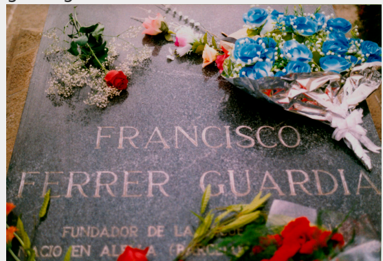
Graf van Ferrer in Montjuïc.