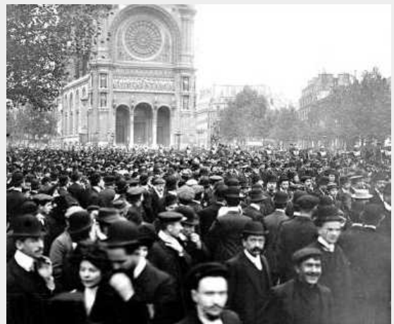
Protest tegen de executie van Ferrer, 17 oktober 1909 in Parijs

Francisco Ferrer werd geboren in een streng gelovig katholiek boerengezin. In 1876 trad hij in dienst bij een Republikeinse eigenaar van een textielzaak, van wie hij veel radicale ideeën leerde. Hij ontwikkelde zich tot een fel tegenstander van het geloof en trad toe tot de Catalaanse vrijmetselaarsvereniging Veritat , te Barcelona. Nadat hij een opstand van de republikeinse oud-premier Ruiz Zorrillas had ondersteund, werd hij in 1885 gedwongen tot ballingschap in Parijs, waar hij Spaanse les ging geven.