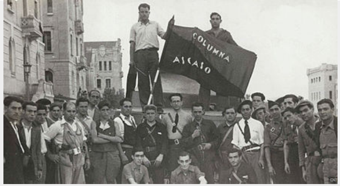
Eenheid genoemd naar Francisco Ascaso.

Catalonië (Comité Central de Milicias Antifascistas de Cataluña). Samen met Durruti zou Ascaso met de CNT wapendepots, militaire barakken en het gevangenschip de Uruguay aanvallen met zelfgemaakte granaten en geïmproviseerde pantservoertuigen.[11] Ascaso zou tijdens die eerste dagen van de revolutie - als één van de 500 slachtoffers aan anarchistische zijde - om het leven komen bij de belegering van de Atarazanas-barakken in Barcelona. Hij ligt begraven op de Montjuïc-begraafplaats waar later ook Durruti begraven zou worden.[12]