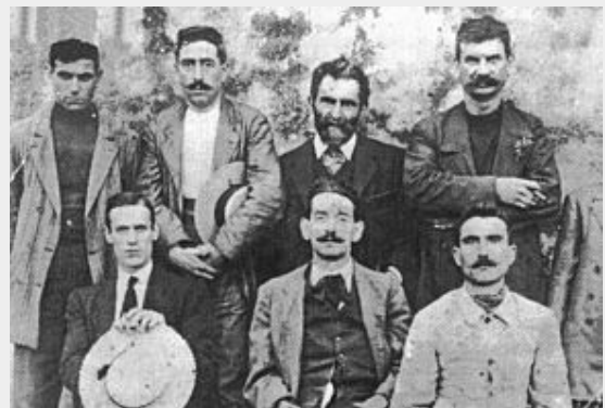
Errico Malatesta (achterste rij, tweede van rechts) samen met strijders van de Arditi del Popolo , in 1921 opgericht als

In 1913 keert Malatesta terug in Italië, geeft daar de Volontà uit in Ancona, maar de uitbraak van de Eerste Wereldoorlog dwingt hem om terug te keren naar