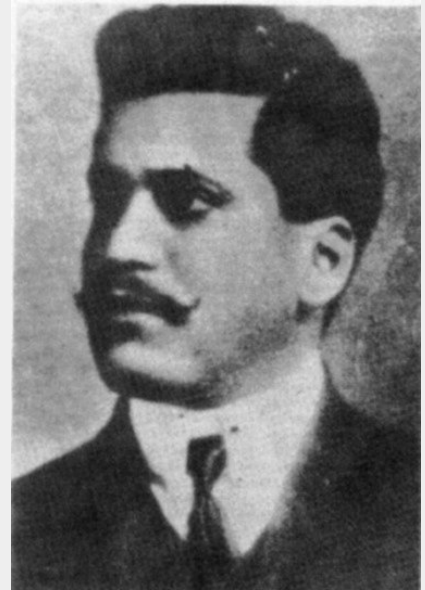
Enrique Flores Magón op jongere leeftijd

Enrique Flores Magón (13 april 1877 - 28 oktober 1954) was een journalist en anarchist uit Mexico en voorvechter van het anarchisme in Mexico tijdens de Mexicaanse Revolutie van 1910. Enrique was samen met zijn broer Ricardo Flores Magón medeoprichter van Partido Liberal Mexicano (PLM, vert. Mexicaanse Liberale Partij) welke, in tegenstelling tot was de naam suggereert, zich als als een anarchistische partij profileerde. De filosofie die Enrique en Ricardo Flores Magón inwikkelde werd ook wel Magonisme genoemd en legde een verband tussen anarcho-communistische ideeën over wederkerig dienstbetoon van Peter Kropotkin en lokale inheemse en agrarische bewegingen.