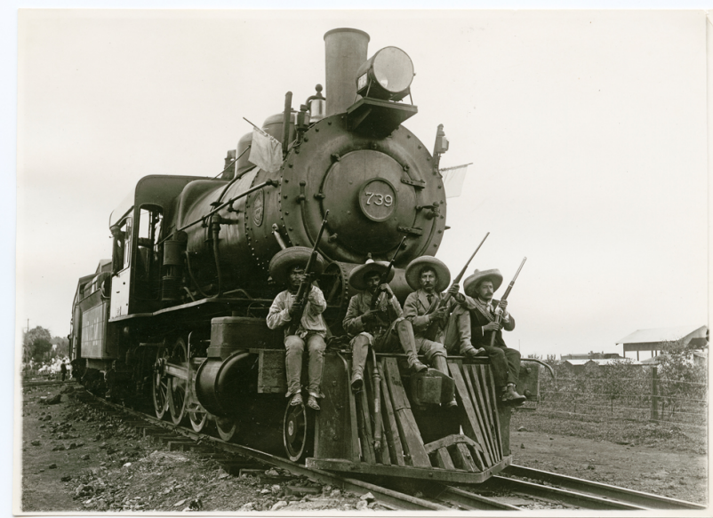
Zapatistische strijders voor een trein, 1911

alweer hervat. In zijn laatste dagen zou Madero dit een van de meest tragische gebeurtenissen uit de Mexicaanse geschiedenis noemen.