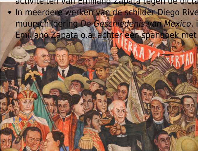
Zapata in een muurschildering van Diego Rivera, Mexico City, 1929-1935.