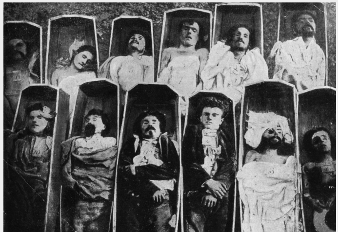
Slachtoffers van de terreur van de Franse staat