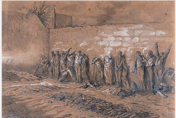
Executie van communards Pere Lachaise

Achter deze hoge, maar dode cijfers schuilt dikwijls een wrede werkelijkheid. Officieren, bijgestaan door politie-commissarissen beslisten na een summiere ondervraging, of zelfs alleen maar bij het