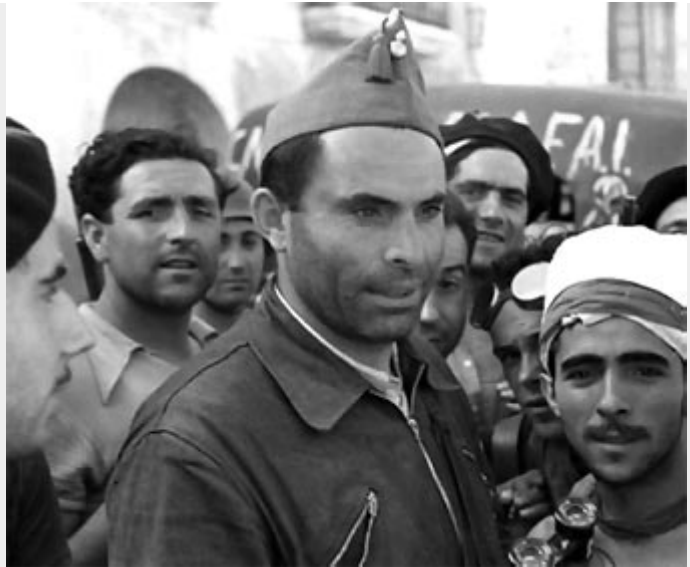
Durruti in een menigte op straat.

Maar de oorlog stond op het punt verloren te worden. De fascistische troepen stonden al in de voorsteden van Madrid. En dus verzochten allen, zonder onderscheid naar partij of groepering, Durruti om zich met een deel van zijn troepen naar Madrid te verplaatsen. Noch García Oliver, noch Durruti waren er bijzonder van overtuigd dat het wat uit zou maken, maar als Madrid verloren zou gaan, dan zou het front ineens instorten en dat zou het onherroepelijke einde wezen. Durruti verplaatste zich met een deel van zijn troepen naar Madrid, zonder zijn posities aan het Aragonese front op te geven. De fascistische opmars werd gestuit, maar de prijs was hoog. Durruti stierf. De omstandigheden waaronder zijn nog steeds onderwerp van discussie. Abel Paz houdt het erop dat de kogels, die een eind aan Durruti's leven maakten, uit de loop van de Russische geheime dienst GPOE kwamen. Hij