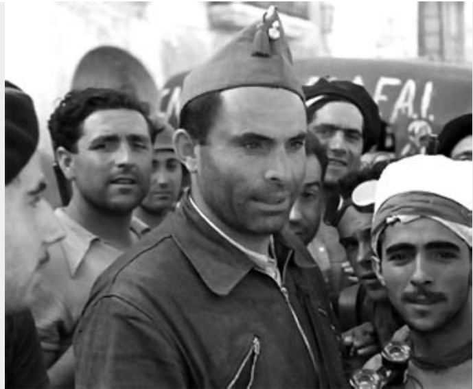
Durruti in een menigte op straat.

Zo ook Durruti. Hij vormde de naar hem vernoemde Durruti Kolonne die tot november 1936 met name aan het Aragonese front vocht. Anderzijds maakten de vakbonden zich meester van de fabrieken, werkplaatsen en de diensten in Barcelona en de rest van de Republikeinse zone. Terwijl aan de oorlogsfronten met veel te weinig wapens en een gebrekkige infrastructuur stand werd gehouden, collectiviseerden de anarchistische milities op hun doortocht de boerenbedrijven, organiseerden collectieven en schaften het private eigendom af. Aan de andere kant brachten de burgerlijkste partijen van de Republiek, met hulp van tot voor kort ondenkbaar geachte bondgenoten zoals de Spaanse Communistische Partij (PCE) en de regering van de Sovjet Unie, wiens grootste zorg het was dat zijn positie als het 'socialistische vaderland' bedreigd werd door de potentiële opbouw van een ander socialistische land dat buiten zijn invloedssfeer verkeerde, de reactie op gang. De militarisering van de milities (waar men geen rangen kende) werd al vroeg in gang gezet. Collectivisaties werden teruggedraaid. In de republikeinse pers begon een smaadcampagne tegen anarchisten van de CNT-FAI en links-communisten van de POUM. Tevens bouwde de Russische geheime dienst een uitgebreid netwerk van spionnen en stromannen op. Ook de bekende Internationale Brigades waren een door Moskou aangestuurd instrument.