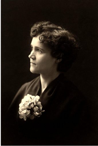
Voltairine de Cleyre.

eenvoudigweg als 'anarchist' aanduidde en opriep tot het verder aannemen van het anarchisme zonder adjectieven. Zij was van mening dat er op verschillende plekken geëxperimenteerd moest worden om vast te stellen wat de beste organisatorische en economische vorm is die bij het anarchisme past. De Cleyre probeerde in haar artikel Anarchism de verschillende stromingen dichter bij elkaar te brengen en stelde dat vrijheid het uitgangspunt zijn moest: