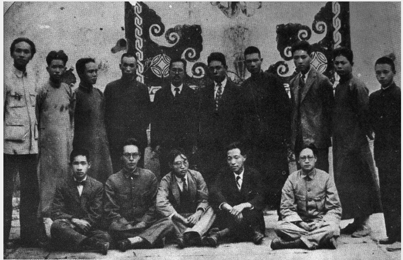
Bijeenkomst van de Oost-Aziatische Anarchistische Federatie, 1927

Kortom, overal waren anarchisten actief, in hun eigen organisaties of die van anderen, actief in propaganda voor het anarchisme, onder arbeiders en boeren, en in het organiseren van deze groepen tot strijd. De term 'federatie' suggereert meer dan het was; de groepen waren vooral autonoom, gericht op hun eigen activiteiten, al was er veel onderling contact en correspondentie.