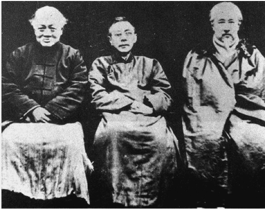
Leiders van de Vereniging voor de Studie van het Socialisme