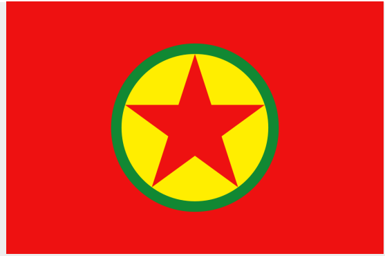
Vlag van de Koerdische Arbeiderspartij (PKK)

Het was pas op het moment dat Abdullah Öcalan werd gevangengenomen, dat hier werkelijk verandering in kwam. In de teksten voor zijn verdediging en de gesprekken met zijn advocaten - die hij slechts 2 uur en later 1 uur per week kon zien - droeg hij kleine stukken tekst over die samen twee belangrijke werken vormden waarin hij zijn nieuwe voorstellingen naar buiten bracht.[4] Toen de Turkse staat lucht kreeg van wat gaande was, werden de bezoeken gedwarsboomd. Advocaten mochten steeds minder voorbij komen en er werden allerhande beperkingen opgelegd, zoals een verbod om zaken over te dragen of zelfs aantekeningen van de gesprekken te maken. In 2011 werd