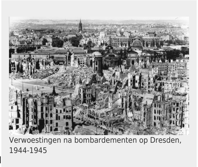
Verwoestingen na bombardementen op Dresden, 1944-1945

De opkomst van het fascisme en de Tweede Wereldoorlog stelde het pacifisme voor een groot dilemma. Er waren in de aanloop naar de oorlog verschillende pogingen om zich te verzetten tegen het daarbij eveneens opkomende militarisme, al was dit vooral in landen waar het fascisme geen werkelijke voet aan de grond had. In die landen was namelijk geen tolerantie voor pacifistische opvattingen - deze zouden de nationale belangen schaden. Alex Comfort (1920-2000) was arts in Groot-Brittannië en een bewuste dienstweigeraar tijdens de oorlog. Hij was actief lid van de Peace Pledge Union (PPU), dat voor de oorlog nog stelde dat als de maatregelen van het Verdrag van Versailles [7] zouden worden teruggedraaid, Nazi-Duitsland diens agressie zou staken. George Orwell, een criticus van het pacifisme, wierp pacifisten voor dat zij "objectief gezien pro-fascistisch" waren door te argumenteren dat "als je de oorlogsinspanningen van de ene partij dwarsboomt, je automatisch die van de andere helpt." [8] Na de annexatie van Sudetenland en de aanval op Tsjecho-Slowakije en Frankrijk zakte het lidmaatschap van de PPU in elkaar. De organisatie veranderde dan ook van stellingname en begon zich vooral te richten op de ondersteuning van dienstweigeraars en verzette zich tegen het bombarderen van civiele doelen in Europa door de geallieerden. Comfort schreef hiervoor in een Britse krant: