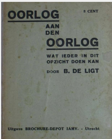
B. de Ligt, Oorlog aan den Oorlog , c.a. 1933

Militarisme betekend dat men de invloed van het leger op de burgerlijke samenleving accepteert of zelfs viert, wat vaak ook gepaard gaat met sterk nationalistische opvattingen. In de samenleving heeft dit uitwerking op de opvatting over hiërarchieën, discipline en het volgen en gehoorzamen van bevelen. Het leger vervult in dat geval vaak ook een symbolische rol die het welvaren en de trots van een land weerspiegelt. Dit uit zich in culturele zin door een voorliefde voor militair vertoon, volksliederen, rangen, orden en vlaggen. Het antimilitarisme richt zich juist tegen het gemilitariseerde staatsapparaat en stelt dat het de vrije geest van de bevolking verstikt.