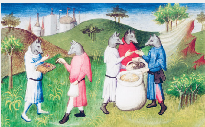
De Andaman-Eilanden in de Baai van Bengalen zouden door mensen met wolvenkoppen worden bewoond. Zij werden in het "Boek der wonderen"

Een zowel oud als hedendaags voorbeeld wat vaak wordt gebruikt om te verwijzen naar een voorbeeld van anarcho-communisme in de praktijk is de jager- en verzamelaarsbevolking van North Sentinel Island . North Sentinel Island is onderdeel van de Andaman Eilanden in de Baai van Bengalen bij India, en wordt bewoond door de Sentileense stam, die al zeker 60.000 jaar op het eiland wonen. Zij praktiseren een vorm van primitief communisme waarbij alle eigendom gemeenschappelijk is en er geen hiërarchieën bestaan tussen de verschillende leden van de groep. De werkers, zowel man als vrouw, beheren samen de productie. Alle materialen die worden geproduceerd en verzameld gaan